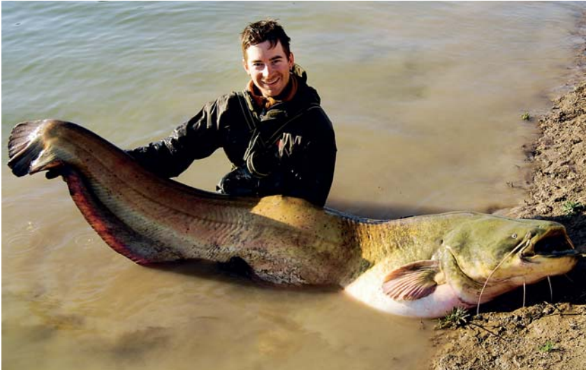
Și ziua la fel