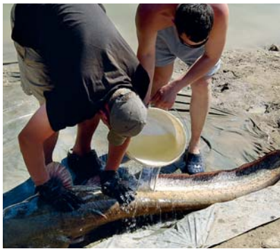
În timpul sesiunii foto, somnii trebuie ținuți umezi sau lăsați în apă

Pentru preparatele culinare din somn se recomandă întotdeauna peștii tineri. Deci nu ar fi nimic de obiectat ca somnii până în 1,5 metri să fie opriți pentru consumul propriu. Așa tragem cu toții foloase de aici: este destul pește tânăr pentru mâncat, iar somnii bătrâni și puternici ce ne aduc satisfacție totală în dril, se pot dezvolta în continuare, păstrându-se în viitor pentru toți pescarii!