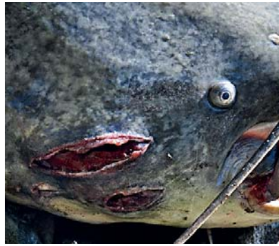
Au fost cazuri când au fost prinse exemplare cu ștreanguri în gură sau mutilate de gafe sau cârlige

după care măsurăm somnul. O găleată cu apă să avem tot timpul lângă noi, pentru a putea umezi somnul în permanență, mai ales pe timpul verii. Dacă dorim să îl și cântărim, avem nevoie de o prelată specială de cântărit, de un cântar ce poate cântări mai mult de 100 de kilograme, câteva ajutoare, de obicei chiar 4 persoane. Procesul de cântărire fiind complicat și periculos pentru pește, eu mă mulțumesc cu măsurarea acestuia și aprecierea greutateii lui, după următoarea regulă: